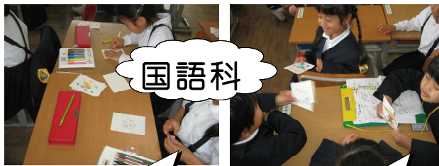
2年生への名刺づくり

「がっこうたんけんをしよう」は生活科の学習ですが、表現は国語科や図工科といった他教科につなげていきます。生活科のねらいを達成するために行った体験的な学習が、他教科の学習にも生かされるよう構成し、合科的な大単元を組みました。こうした大きな単元では、児童が自らの思いや願いの実現に向けた活動をゆったりとした時間の中で進めていくことが可能になります。